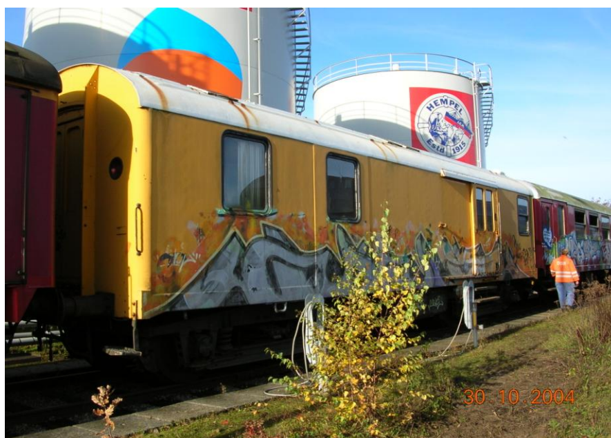
Figur 2 : Bdaf 9

Vognen der er bygget i 1963 til DSB er næsten magen til den Dh som vi har, og er meget glad for. Vognens DSB nummer er 50 86 926 8029-3 hos Vestsjællands lokalbaner hed den OHJ Bdaf 9