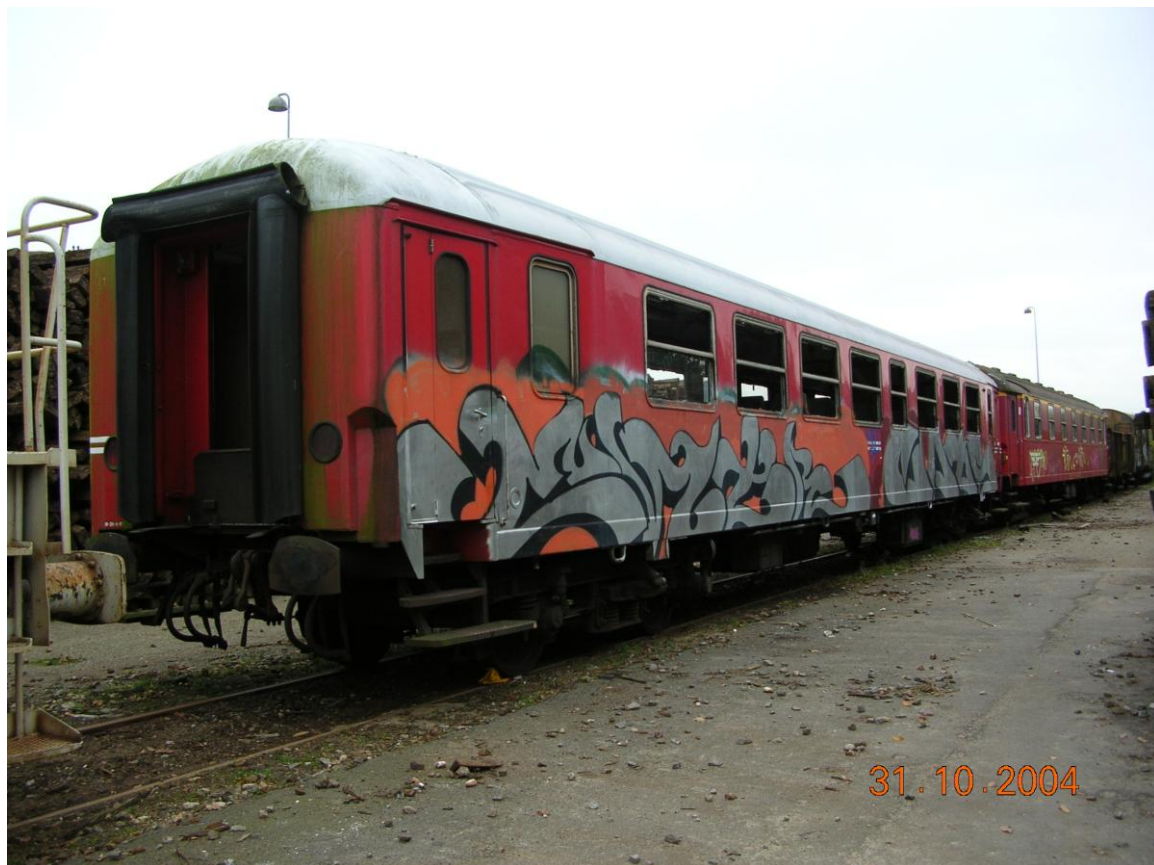
Figur 1: OHJ Bf 287

Vognen er bygget i 1959 og havde nummer 508627-55 326-9 hos Vestsjællands lokalbaner hed den OHJ Bf 287.